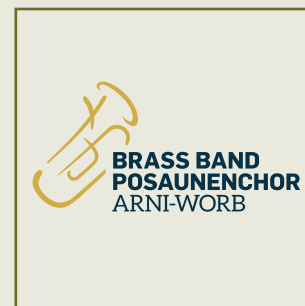
Logo ab 2020