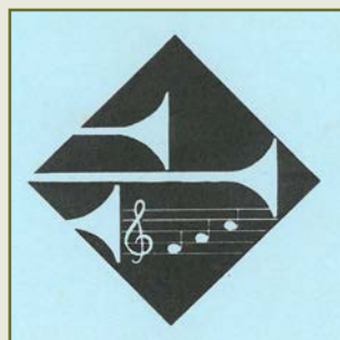
Logo ab 1983